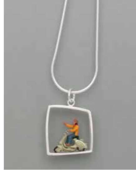
Eine von Hand bemalte Figur sitzt im Silber-Rahmen beim Schmuckwerk Hübener