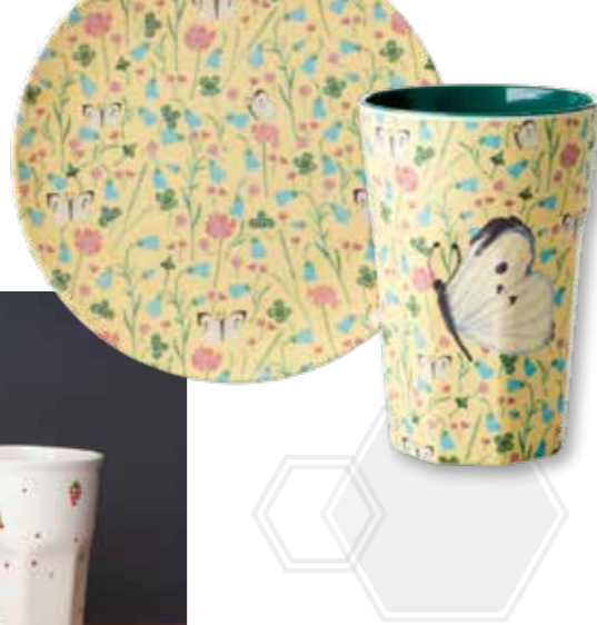
Bei Selsius schmücken haptische Punkte sowie Kirschen und Trauben Porzellanbecher