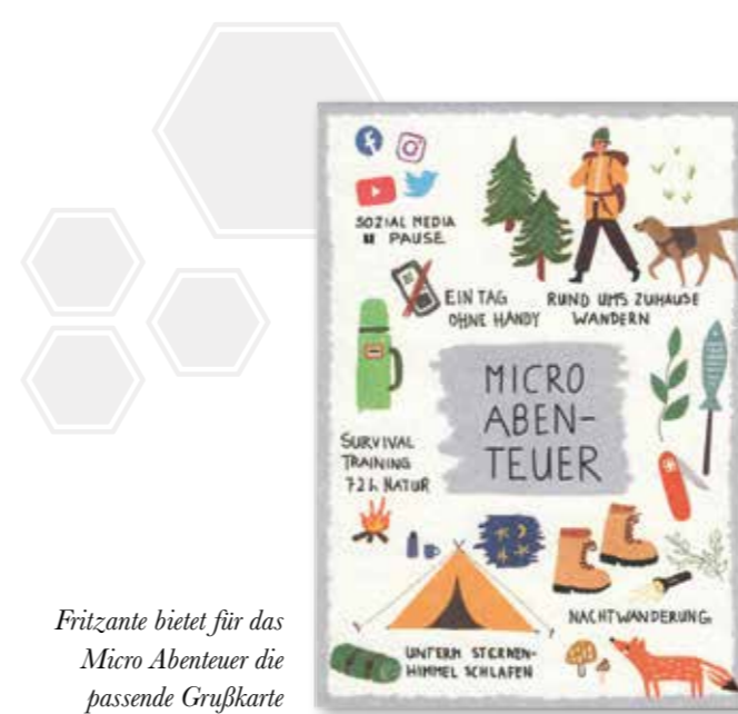
Fritzante bietet für das Micro Abenteuer die passende Grußkarte

in der ersten Augushälfte die beste Chance auf Sternschnuppen, im Herbst kann man sich ein Laubbett bauen und im Winter ein Eisbad nehmen. Beim Moses Verlag bekommt man eine Box mit 50 Karten, die kreative, anregende und zum Teil auch überraschende Ideen für Abenteuer im Alltag geben. Im Garten zelten, eine Nachtwanderung machen oder ein Möbelstück restaurieren – alles Aktivitäten, die man wunderbar zu Hause oder ganz in der Nähe machen kann. Durch das kompakte Format von 7,5 x 10 Zentimetern sind diese auch zum Mitnehmen geeignet und daher ideal für unterwegs. Mit der Grußkarte Micro Abenteuer von Fritzante kann man dann andere an seinem neuesten kleinen Erlebnis teilhaben lassen. Die A6 Karte ist auf 580 Gramm Holzschliffpappe, einem Recyclingprodukt, gedruckt.