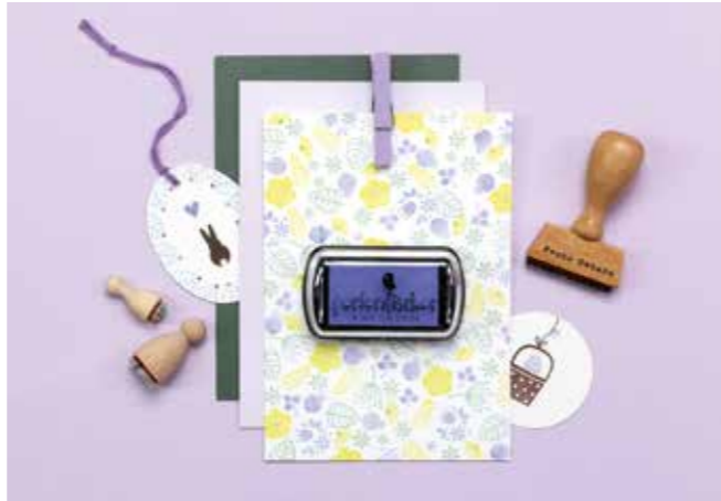
Verschiedene Stempelmotive von Perlenfischer lassen sich gut zu Allover-Mustern kombinieren