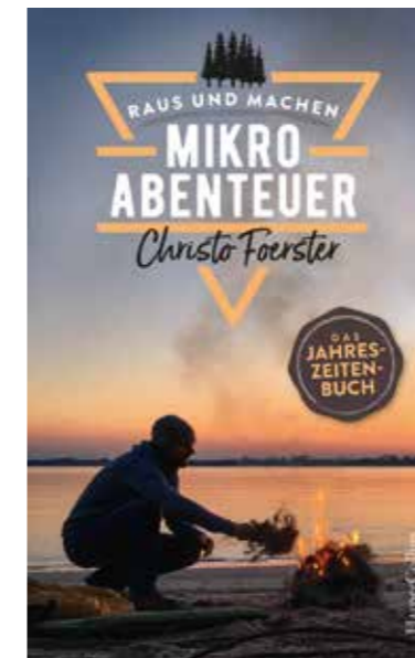
Das dritte Buch über Mikroabenteuer ist 2021 in der Verlagsgruppe HarperCollins erschienen

TRENDagentur Gabriela Käiser, www.TRENDagentur.de