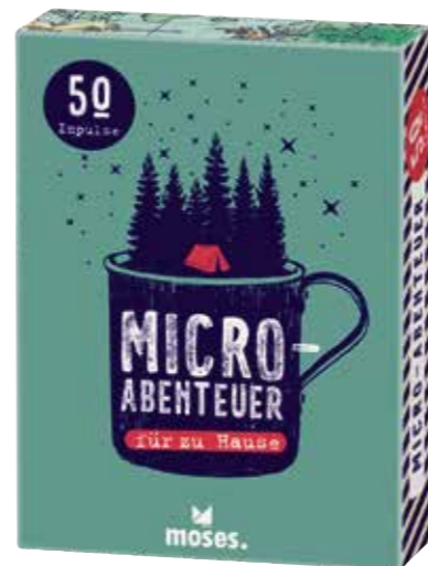
Eine Box mit 50 Ideen für Microabenteuer zu Hause gibt es beim Moses Verlag