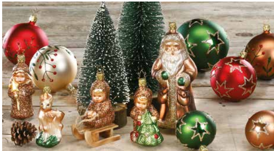
Trend 2020 WINTER WOODLAND