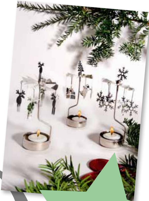
Bei Pluto gibt es eine ganze Welt von kleinen drehenden filigranen Teelichthaltern