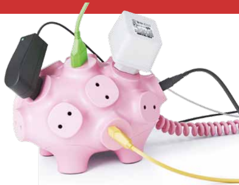
Das „Svintus Power strip Pig“ von Art Lebedev bringt Fun in die Verteilersteckdosen-Welt

Rauchmelder sind ein wesentlicher Bestandteil der Sicherheitseinrichtung im Haus, aber sie sind leider nicht für eine ansprechende Gestaltung bekannt. Bei vielen anderen funktionalen Produkten sieht es nicht anders aus. Darf gutes, funktionales Design nicht emotional sein, weil es sonst kein gutes Design ist, nach dem Motto „form follows function“? Oder darf Design vielleicht doch auch emotional berühren?