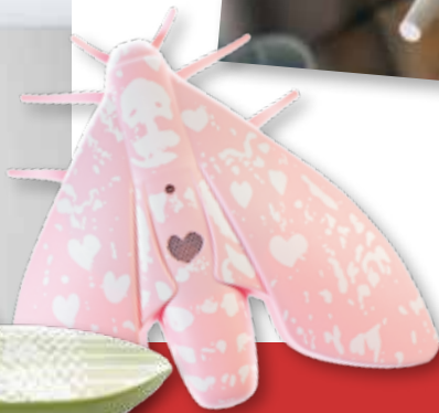
Einen Rauchmelder, der mit dem Red Dot Design Award ausgezeichnet ist, gibt es bei Jalo