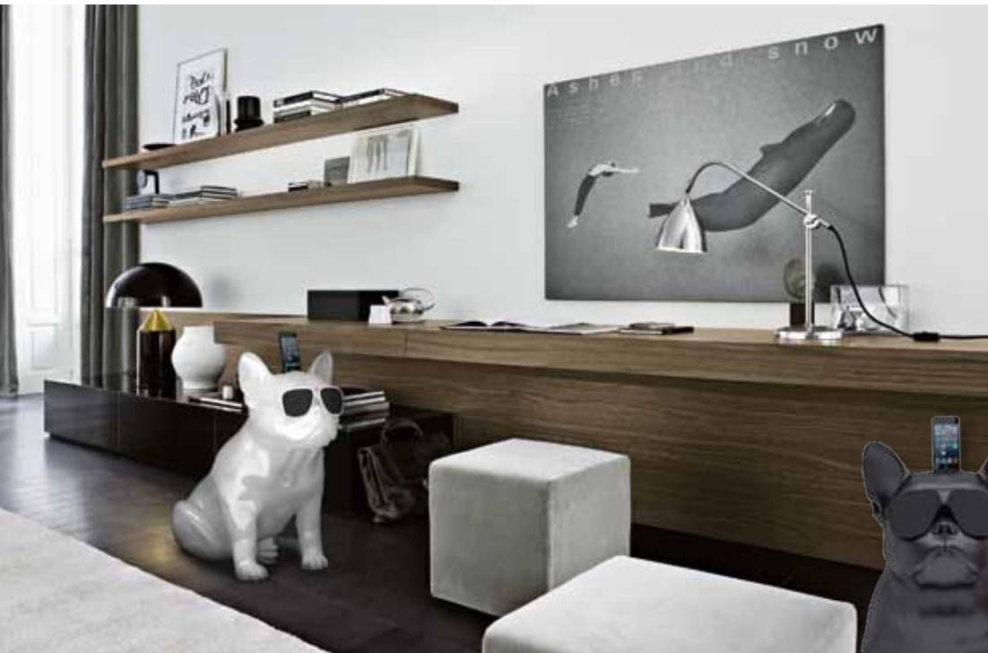
„AeroBull“ von Jarre Technologies sorgt als Lautsprecher für Aufsehen