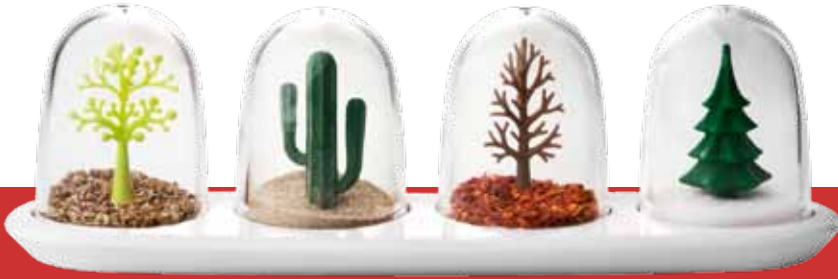
„Four Seasons“ ist eine poetische Variante von Salz, Pfeffer und Gewürzstreuer

einen kleinen schnabelförmigen Ausgießer. So kann man genau dosieren, wie viel Öl man über die Speisen gibt, je nachdem, ob das Gericht nun einen Tropfen oder einen Schuss verlangt. Gleichzeitig verhindert der Verschluss die Oxidation und somit das Sauerwerden des Öls. Und das Schönste ist, dass auch dieser Ausgießer mit Olivenkopf, Stengel und Blättchen dabei eine besondere Ästhetik hat.