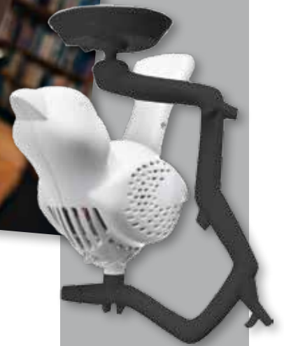
Der australische Rauchmelder „Chick a Dee“ ist auch in Europa erhältlich