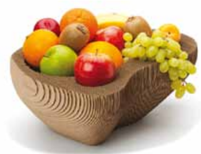
Die Obstschale von SEMdesign wird aus 128 Lagen Recyclekarton handgefertigt