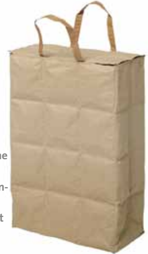
Die Isoliertasche aus Rohpapier von Valeria Santagati kann warm oder kalt halten

teilweise hohen Anschaffungskosten möchten wir uns von diesen aus Vernunftsgründen dann auch erst einmal nicht so schnell wieder trennen. Möbel aus Pappe sind da eine echte Alternative. Sie lassen sich oftmals einfach auseinander falten und zu flachen Paketen zusammen