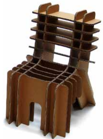
Das modulare Bücherregal Q2 und Q3 von Dry Design schafft Stauraum unter Dachschrägen. Der „FIY junior“ von Grass wird selbst zusammengebaut