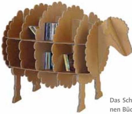
Das Schafregal von Stange-Design bietet CDs und kleinen Büchern nicht nur im Kinderzimmer Platz