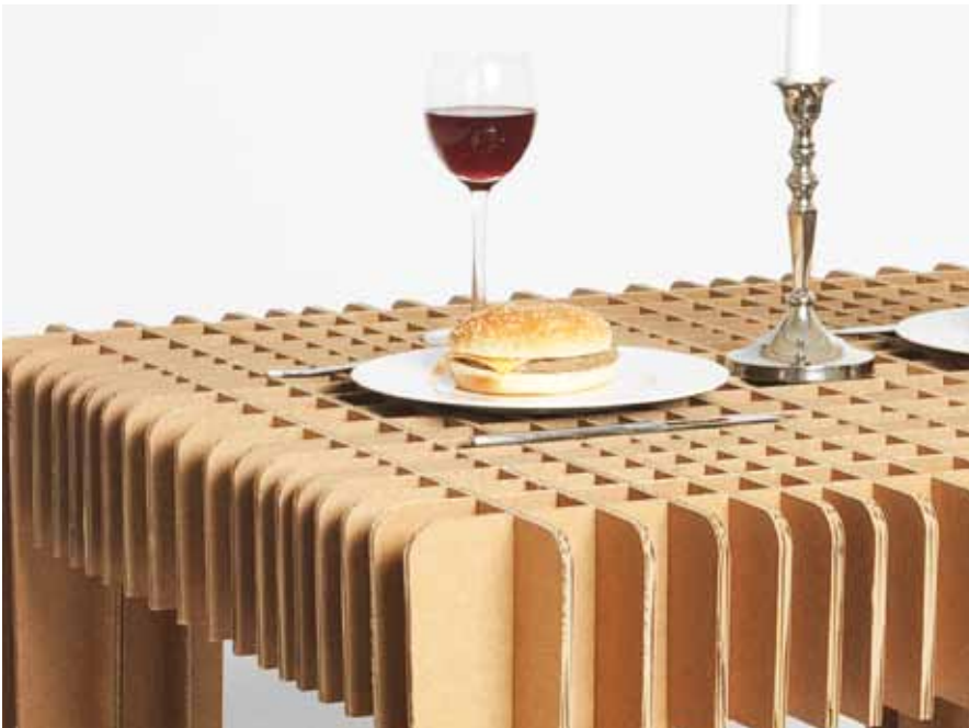
Stabil und schön: Die Konstruktion des DSYDTable von Graas verleiht nicht nur Stabilität, sondern macht den Tisch zu einem Designobjekt

Birne, Stecker und Anleitung verpackt. Von der Verpackung muss nur noch Boden und Deckel entfernt werden und schon kann ich aus dem einstigen Verpackungskarton eine stylische Lampe zusammen bauen. Das ist doch einmal wirklich eine super Möglichkeit Müll einzusparen. Nicht nur Möbel und Lampen lassen sich aus Pappe fertigen. Im Prinzip gibt es fast keine Einschränkungen. Unsere Pizza essen wir ja auch schon mal aus dem Pappkarton, und sei es auch nur, weil wir unterwegs sind. Das liegt aber daran, dass sich die Pizzabox gestalterisch einfach noch mehr unserer Form von Ästhetik angleichen muss. Das kommt bestimmt noch. Obstschüsseln aus Pappe sehen ja auch verboten schön aus.