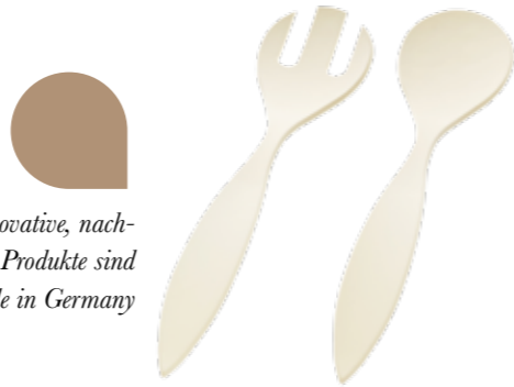
Magus innovative, nachhaltige Produkte sind Made in Germany