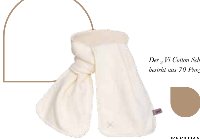
Der „Vi Cotton Schal“ von Farbenfreunde besteht aus 70 Prozent recycelter Baumwolle