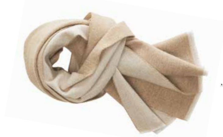
Der Double-Face Schal „Luca“ von Eagle Products ist Made in Germany