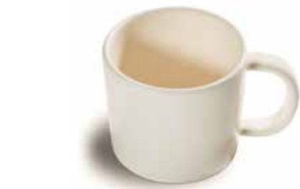
Mit der „Salzkammergut-Keramik“ vereint Gmundner Qualität, Stil und Erschwinglichkeit