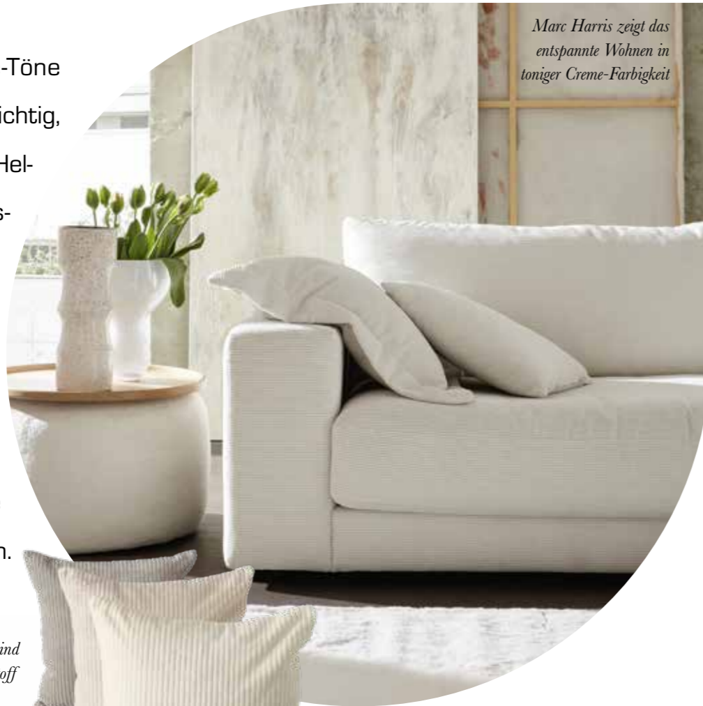
Marc Harris zeigt das entspannte Wohnen in toniger Creme-Farbigkeit

Sanfte Creme-Beige-Töne bleiben auch 2024 wichtig, da diese Farbigkeit, Helligkeit und Ruhe ausstrahlen, dabei aber trotzdem warm und gemütlich wirken. Dabei darf es gerne ganz tonig zugehen – sowohl bei der Mode als auch beim Wohnen.