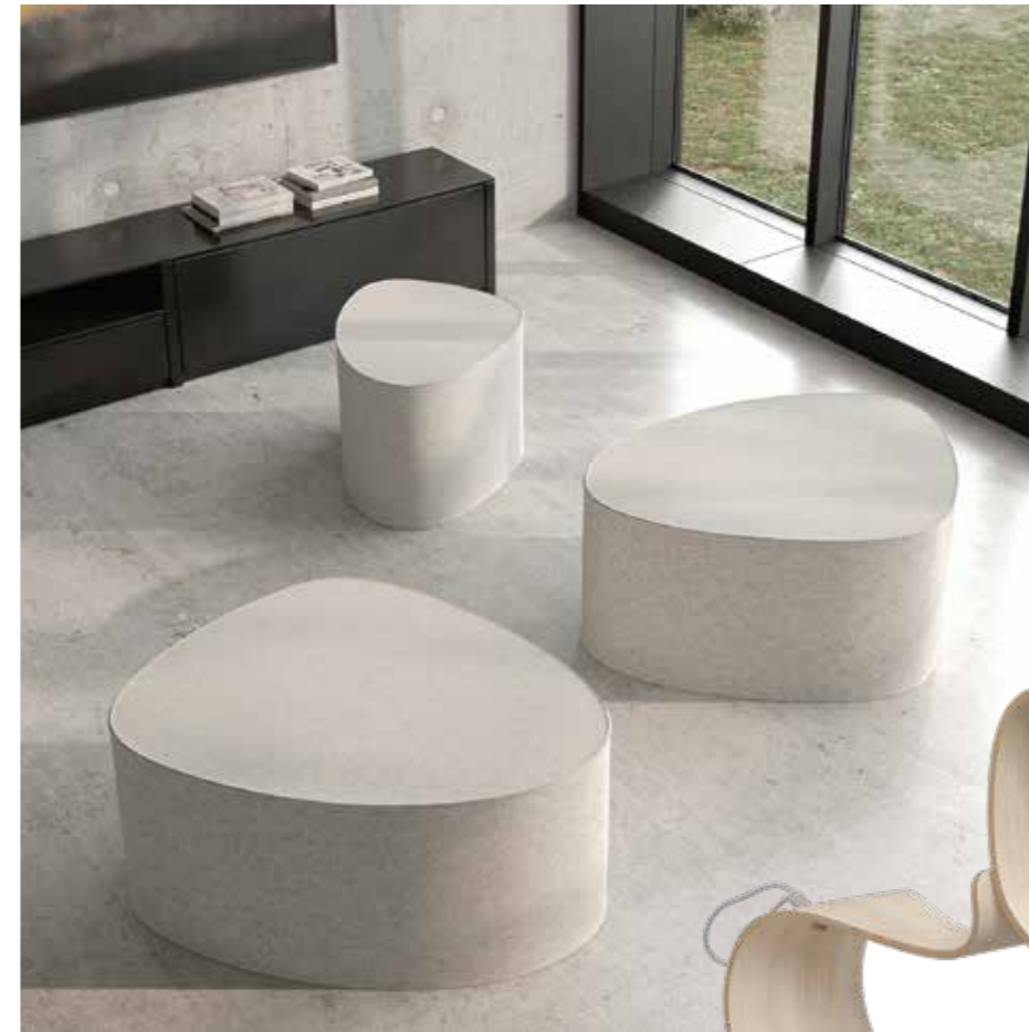
Das Sitzmöbel „Stone“ von Hey-Sign ist von den organischen Formen natürlicher Steine inspiriert

Im Thema „Landliebe“ der Schöner Wohnen Kollektion wirken Motive und Farben beruhigend