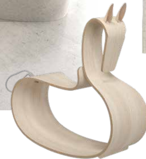
Das Schaukelpferd von Fritz Hansen integriert sich im hellen Holz in das Interior