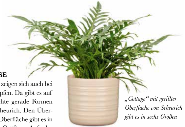
„Cottage“ mit gerillter Oberfläche von Scheurich gibt es in sechs Größen