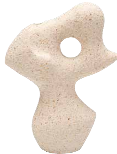
Die Vase „Muse“ von Kare Design wirkt auch ohne Blumen wie ein Kunstwerk

für die Gruppe H tätig war. Speiseteller, Schüssel, Becher und Kaffeeschale mit Henkel sind nicht nur zeitlos schön sondern auch äußerst funktional und langlebig sowie zudem preislich erschwinglich. Die spülmaschinenfeste und mikrowellengeeignete Keramik wird zu 100 Prozent im Salzkammergut gefertigt. Die „Amuse“-Linie von Cosy & Trendy kommt dagegen in handwerklicher Optik daher. Lässige Rillen in der Oberfläche, eine Glasur mit Sprenkeln und teils raue Bereiche in der Oberfläche laden zum haptischen Erleben ein. Die Formensprache des Aperitif-Geschirrs ist leicht unregelmäßig und gewellt. Das 16-teilige Geschirr besteht aus Tellern, Schüsseln, Bechern und Servierbrettern, die zum Kombinieren miteinander und übereinander für gesellige Momente einladen. Das in Antwerpen ansässige Mutter-Tochter-Kollektiv Spots&Freckles hat dieses umfangreiche Set von Hand und mit viel Liebe entworfen. Bei Magu finden sich Schüssel, Schale, Salatbesteck, Butterdose und Aufbewahrungstöpfe für Zwiebeln und anderes aus einem preisgekrönten nachhaltigen Werkstoff aus natürlichen und nachwachsenden Rohstoffen. Die Produkte werden in Deutschland im Kaiserstuhl hergestellt, erfüllen höchste Lebensmittelstandards, sind robust, langlebig und spülmaschinengeeignet - abgesehen von den Buchenholzdeckeln der Aufbewahrungsbehälter.