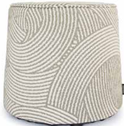
Der Hocker von Rohleder passt durch sein zeitloses Design in fast jedes Interior