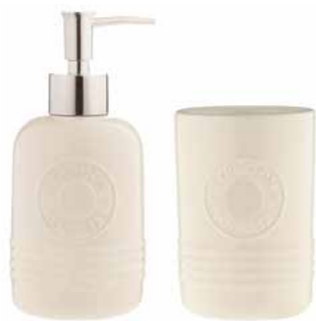
Seifenspender und Becher von Typhoon sind im Bad aber auch Küche nützlich

Selbst für das Badezimmer findet sich bei Brabantia softes Beige in der „ReNew-Badezimmer-Kollektion“, denn gerade hier sollte ein Ort der Entspannung sein. Bad- und Duschablage, Duschkabine-abzieher, Personenwaage, Spiegel mit Ablagefach, Seifenschale und Seifenspender, Zahnbürstenhalter und Handtuchhaken, Aufbewahrungsbehälter, WC-Bürste mit Halter, Toilettenpapierhalter – all diese Helfer erschaffen zu den meist weißen Sanitärprodukten eine frische und dennoch wohltuend warme und entspannte Atmosphäre. Typhoon hat ein Seifenspender-Becher-Set als Ergänzung in das Living Cream-Sortiment eingeführt. Das Set ist aus Keramik und der Typhoon Schriftzug ist haptisch fühlbar. Zudem geben Rillen den schlichten Produkten einen interessanten Look. Eine Schaumstoffpolsterbasis dient zum Schutz der Keramik. Der Seifenspender hat ein Fassungsvermögen von 320 Millilitern. Das Set macht im Übrigen auch an der Spüle in der Küche eine gute Figur. In den Spender kann dann Spüli eingefüllt werden und im Becher findet die Spülbürste ihren Platz. Zu beziehen ist das Typhoon-Set über Profino.