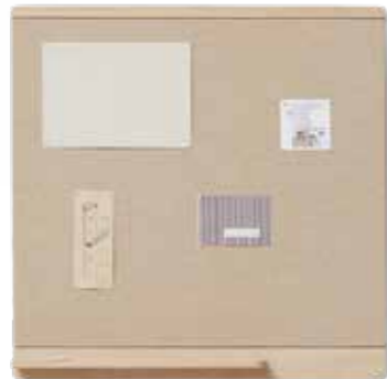
Die Pinnwand „Rim“ von Form & Refine ist mit einem recyceltem Segeltuch bezogen

In New York sieht man junge Erwachsene gerade komplett in Cremetönen gekleidet durch die Straßen laufen und auch im Interior wird die Farbigkeit noch wichtiger, denn immer mehr Menschen sehnen sich nach einem Rückzugsort, der ihnen eine entspannende Ruhe schenkt. Sofa, Kissen, Teppich, Wände, Bilder und Accessoires für Home und Fashion dürfen nun deswegen alle ganz tonig in Creme-Tönen miteinander kombiniert werden. Teils kommt noch helles Holz oder ein zartes Beige dazu. Damit die Optik im wahrsten Sinne des Wortes nicht zu eintönig wird, sorgen verschiedene Oberflächen und Haptiken für Spannung.