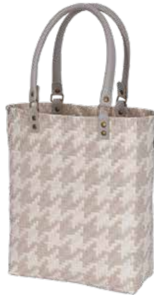
„Mayfair“ von Handed By besteht zu 50 Prozent aus recyceltem Kunststoff