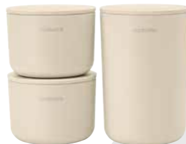
Bei Brabantia hält in der „ReNew-Kollektion“ ein helles Beige Einzug in das Badezimmer

Auf den letzten Modenschauen waren viele Ton in Ton Looks zu sehen. Und so trägt man zum Outfit in Creme die Accessoires in passender Tonigkeit. Der Shopper „Mayfair“ von Handed By ist eine handgeflochtenen Tasche mit Hahnentrittmuster, die es in toniger Farbigkeit gibt sowie zudem mit mehr Kontrast in zum Beispiel schwarz-weiß. Der leichte Shopper wird aus PP handgefertigt, wobei 50 Prozent recyceltes Plastik ist, und ist in zwei Größen erhältlich - mit einer Höhe von 32 Zentimetern und einer Breite von 27 Zentimetern sowie in „grand“ mit 42 Zentimetern Breite bei gleicher Höhe. Die Griffe aus PU-Leder