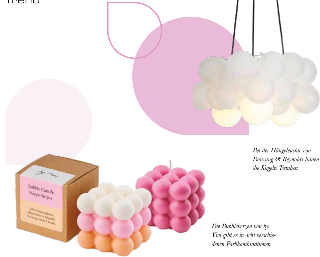
Bei der Hängeleuchte von Dowsing & Reynolds bilden die Kugeln Trauben