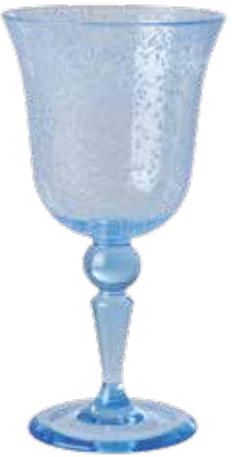
Die Gläser von Rice zeigen ein Meer an Bläschen in dem Acrylglas