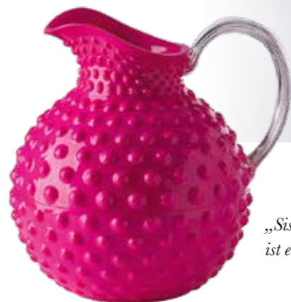
„Sister Rosetta“ von Mario Luca Giusti ist ein Eyecatcher-Krug aus Acrylglas