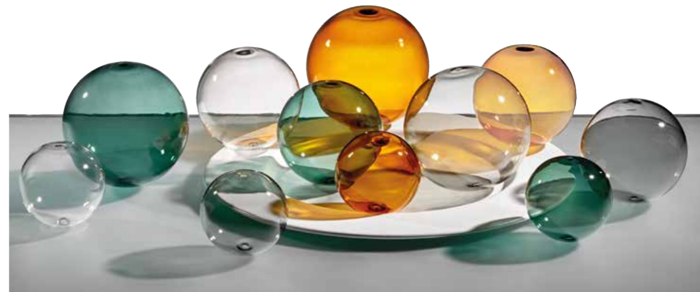
Die transparenten Dekokugeln „Mondez“ von Kaheku gibt es in verschiedenen Farben

ku gehören dazu. Die mundgeblasenen Kugeln gibt es in drei Größen in den Farben Grün, Grau, Hellamber und Amber sowie Klarglas. Nicht nur zum Hinlegen sondern auch zum Hinhängen finden sich mittlerweile Glaskugeln als ganzjähriger Schmuck wie bei der Inge-Glas Manufaktur. Die zarten mundgeblasenen Kugeln schillern sogar Seifenblasen gleich, so dass sie mit ihren verschiedenen Größen zu eine Art Blasen-Schaum gehängt werden können.