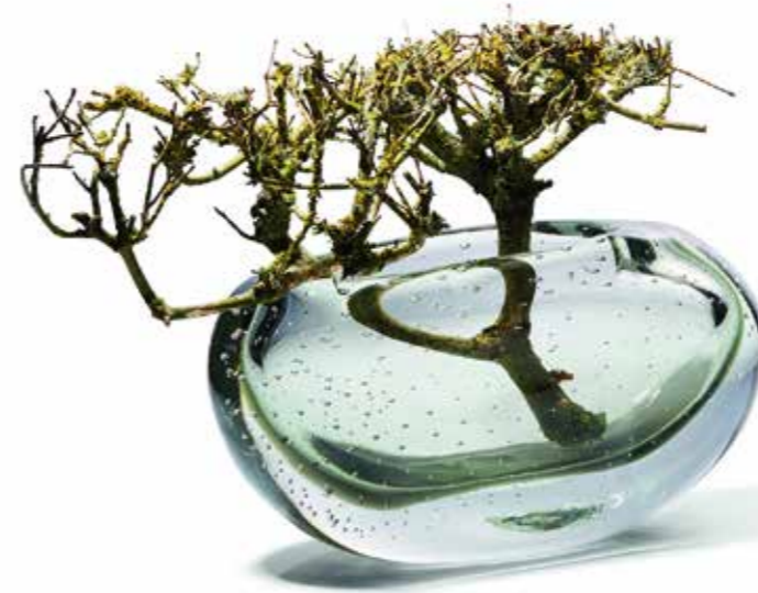
Die Vase „Amara“ von Philippi wirkt dank der Luftbläschen leichter als sie tatsächlich ist

Transparente Produkte können aber auch auf andere Art und Weise eine interessante Oberfläche erhalten. So geben eingeschlossene Luftbläschen dem Material ein Gefühl von dauerhafter Frische sowie Leichtigkeit und das auch bei so schweren Produkten wie der Vase „Amara“, die ein Gewicht von 5 Kilogramm auf die Waage bringt. Schillernd, wie die Unterwasserwelt einer unentdeckten Lagune, sorgt der mundgeblasene Glaskörper von Philippi für einen Moment des gedanklichen Abtauchens. Die Vase „Amara“ quer hat eine Höhe von 14 und in hoch von 19 Zentimetern. Bei Rice haben die Trinkgläser aus Acryl kleine Blubberbläschen im Material, so dass man das Gefühl hat ein besonders spritziges Getränk zu sich zu nehmen. Die gerundeten Softdrink-Gläser mit einer Höhe von 9,4 und die Weingläser mit einer Höhe von 18,5 Zentimetern gibt es in Blau, Mint, Peach und Clear.