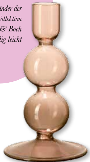
Der Kerzenständer der „like Home“ Kollektion von Villeroy & Boch wirkt luftig leicht