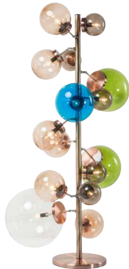
„Balloon Colore“ von Kare Design vereint Funktionalität mit Design-Statement

ren Gelenkarmen befestigt sind, kann man diese immer wieder neu arrangieren. Mit 160 Zentimetern Höhe hat man mit dieser Stehleuchte atmosphärisches Licht und zugleich einen außergewöhnlichen Blickfang im Raum. Kerzen zeigen ebenfalls gerne eine Ansammlung an Kugeln, die hier aber oftmals einer gleichmäßigen Reihung neben- und übereinander folgen. Die „Bubblekerze“ von by Vivi ist quasi ein Kerzen-Kubus aus gestapelten Kugeln, wobei hier jede Ebene eine andere Farbe hat. Die sechs auf sechs Zentimeter großen Kerzen gibt es in acht verschiedenen Farbkombinationen. Die Kerzen werden dabei im Atelier von by Vivi aus biologischem Rapswachs aus den Niederlanden hergestellt.