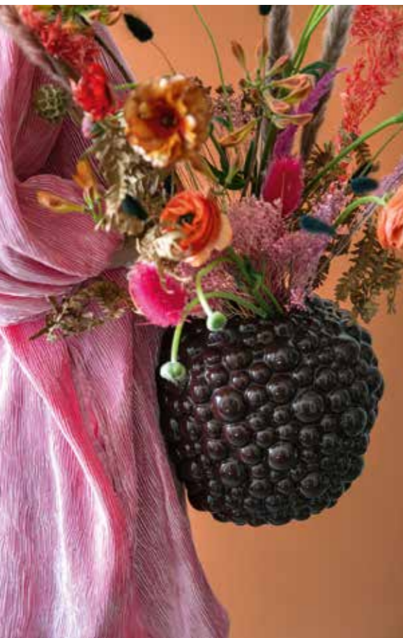
Die Vase „Celeste“ von Byon gibt es in verschiedenen Farben und Finishes