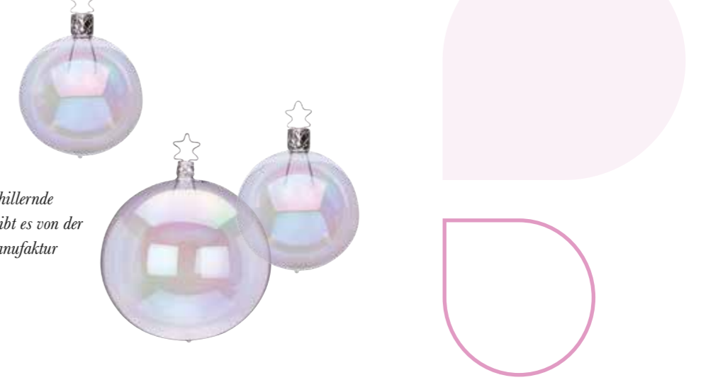
Kugeln wie schillernde Seifenblasen gibt es von der Inge-Glas Manufaktur

Kugelformen und blasige Oberflächen sind schon seit ein paar Jahren ein wichtiger Trend im Interior von den Möbeln bis zu den Accessoires – und es ist noch kein Ende in Sicht. Von daher lohnt sich ein Blick auf die Designwelt rund um die „Bubbles“.