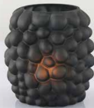
Die Glasartikel von DPI bekommen durch die blasige Oberfläche einen organischen Look