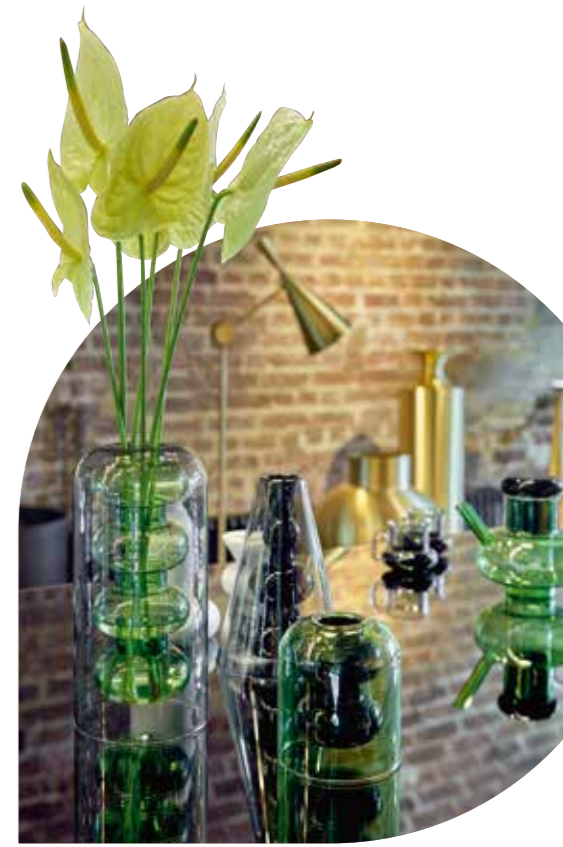
Bei den Vasen und Trinkgefäßen der „Bump“ Serie stapelt Tom Dixon gestauchte Glaskugeln

körper ummantelt. So entsteht eine modern transparente, geschichtete Optik bei den Vasen. Die minimalistischen Gefäße aus Borosilikatglas werden in feinsten Handarbeit angefertigt. Die Designerin Serena Confalonieri wendet sich einer neuen Produktkategorie zu, die durch die zunehmende Legalisierung und Verwendung von Cannabis, mehr in das Interesse von Kreativen rückt – der Wasserpfeife. Die „Nebula“-Kollektion besteht aus drei Objekten, die die Anmutung von zusammengesetzten Blubberblasen haben, und eine Farbigkeit, die an die Psychedelik der 70er Jahre erinnert. Der Name „Nebula“ bezieht sich auf die von Wasserdampf durchdrungene Atmosphäre.