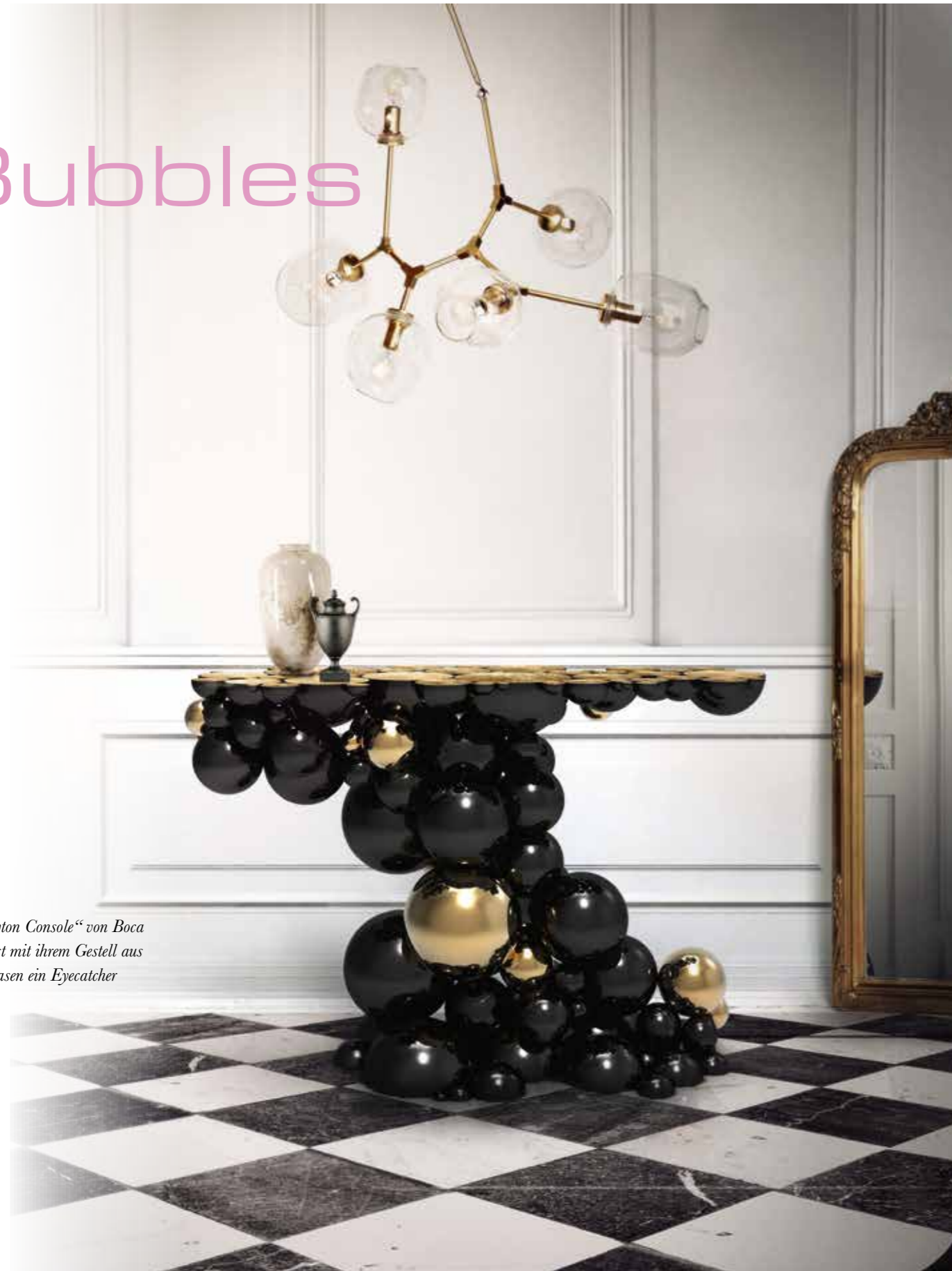
Die „Newton Console“ von Boca do Lobo ist mit ihrem Gestell aus Blubberblasen ein Eyecatcher